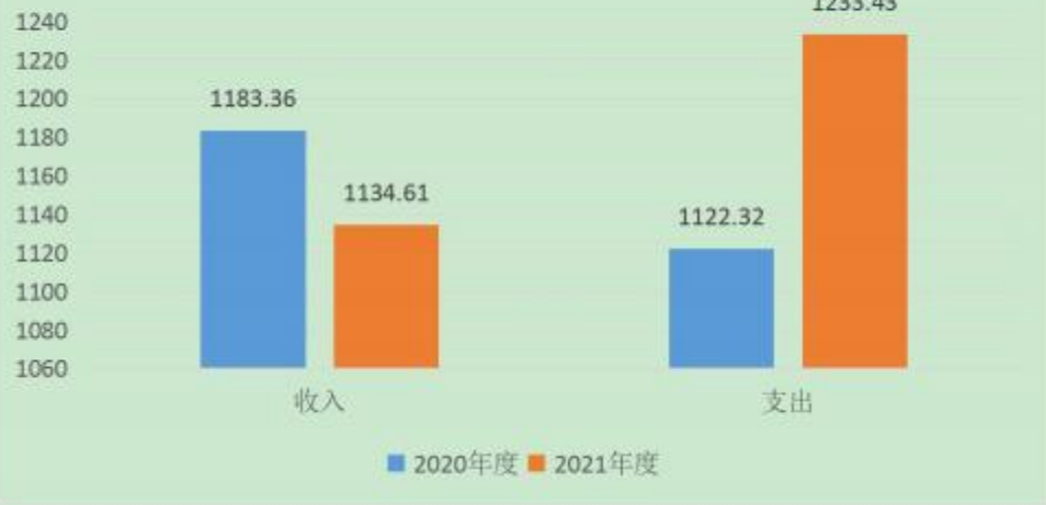
2020与2021年度收入、支出对比图